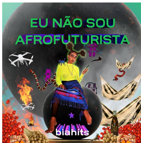
Figura 3 – Capa do álbum sonoro Eu não sou afrofuturista

viveram em Miraíma e Poço da Onça, ambos territórios indígena-quilombolas no estado do Ceará.