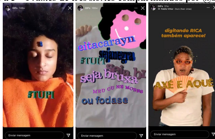
Figuras 1 a 3 – Frames de três stories compartilhados por @biarritzzz 10