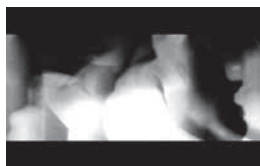
Imagem integrante da videoinstalação Retratos in motion: o beijo (2005)